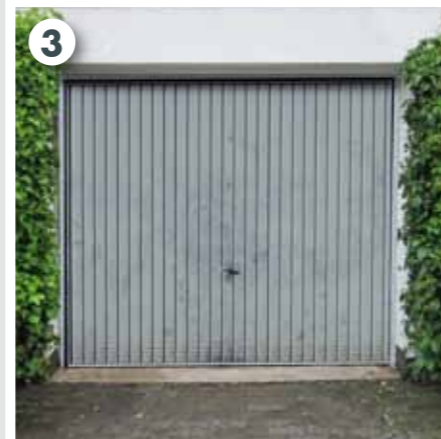
Seitenränder des Garagentors reinigen