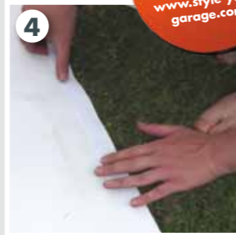
4 Rückseite der Plane an allen Seiten mit Fauschband bekleben

Zusätzliches Befestigungsband für Sektionaltore erhalten Sie auf www.style-your-garage.com