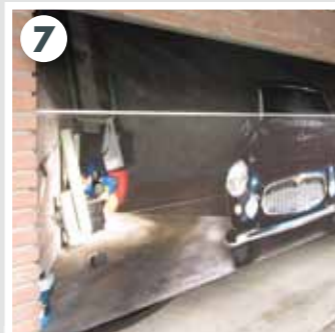
7 Beim Öffnen und Schließen werden weder Folie noch Tor beschädigt