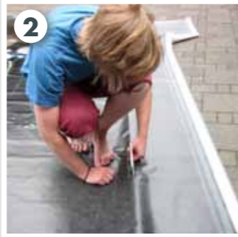
2 Motiv anpassen bzw. zuschneiden