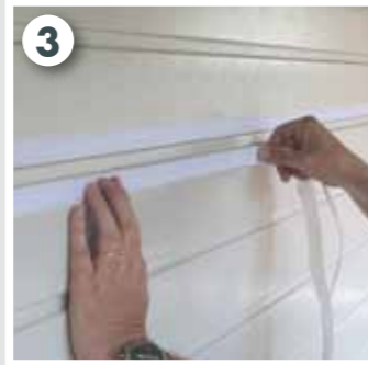
3 Sektionen an allen Seiten mit zusätzlichem Klebband fixieren