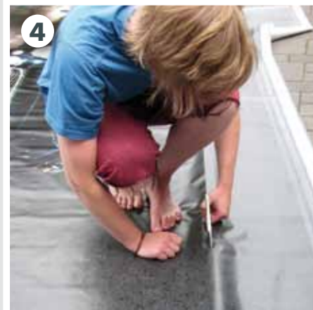
Motiv anpassen bzw. zuschneiden