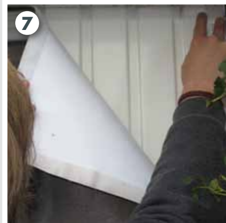
Garagentorplane an Garagentor anbringen