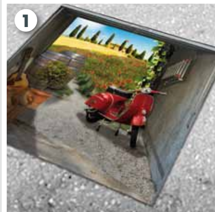
Motiv auspacken und Garagentor ausmessen