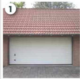
1 Seitenränder des Sektionaltors reinigen und Sektionen ausmessen