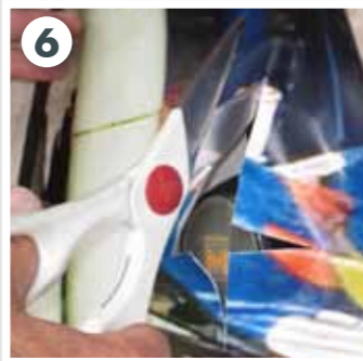
6 Torgriff markieren und einschneiden