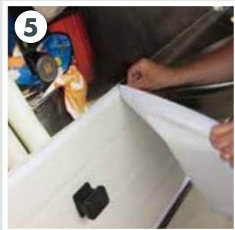
5 Zugeschnittene Planen auf Sektionaltor befestigen

Zusätzliches Befestigungsband für Sektionaltore erhalten Sie auf www.style-your-garage.com