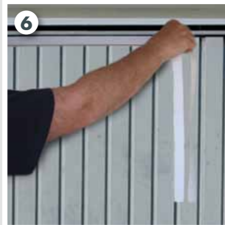
Klettband am Garagentor anbringen